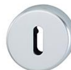
Dörrhandtagsbeslag med rosetter i aluminium