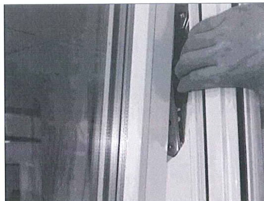
Fig 36. Spärren på beslaget förs mot rummet för öppnande av fönstret.

Vridfönstret är säkrat så att minderåriga ej kan öppna fönstret mer än 10 cm. Utfallsäkringen träder i funktion automatiskt. Säkringen är placerad på karmens högra sida, på beslaget. Säkringen görs åtkomlig genom att fönstret öppnas på glänt och bågen frigörs därefter genom att den rörliga svarta delen förs in mot rummet, se fig 36. Även vid öppning av bågen till putsläget spärras bågen automatiskt. Frigörning av bågen i putsläget görs med säkringen. Är barnsäkerhetsspärren monterad trycks spärren mot karmen, därefter förs spärren in mot rummet.