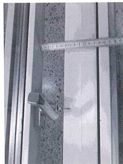
Fig 37. Utfallsäkringen skall låsa bågen så att fritt mått inte överstiger 10 cm.